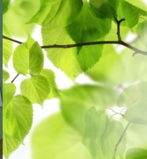
Дидактическая игра « Собери дерево»