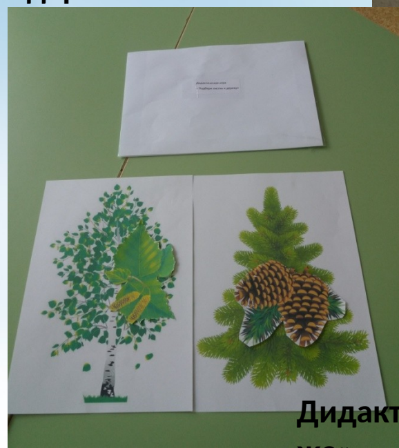
Дидактическая игра « Найди такой же»