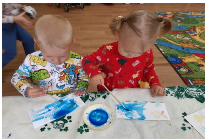
Рисование «Рыбки плавают в водичке»