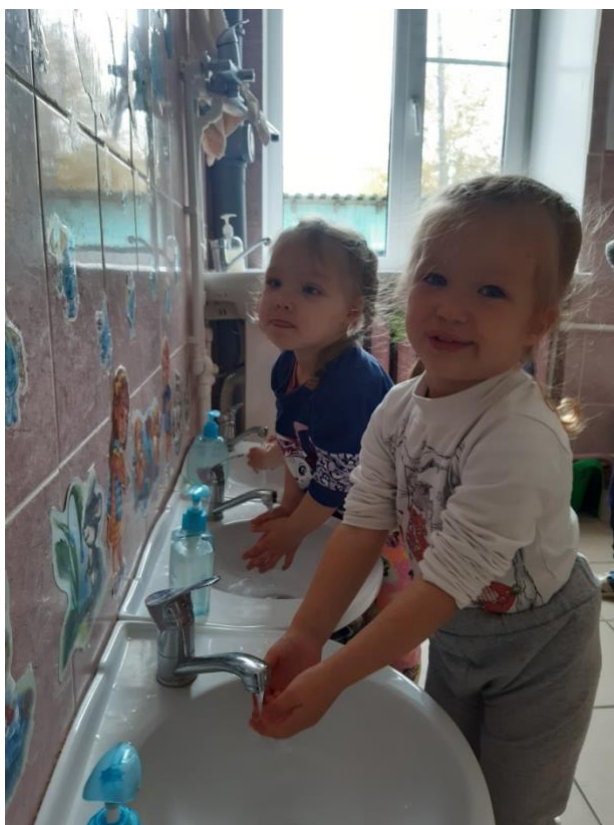
«Водичка, водичка, умой моё личико»