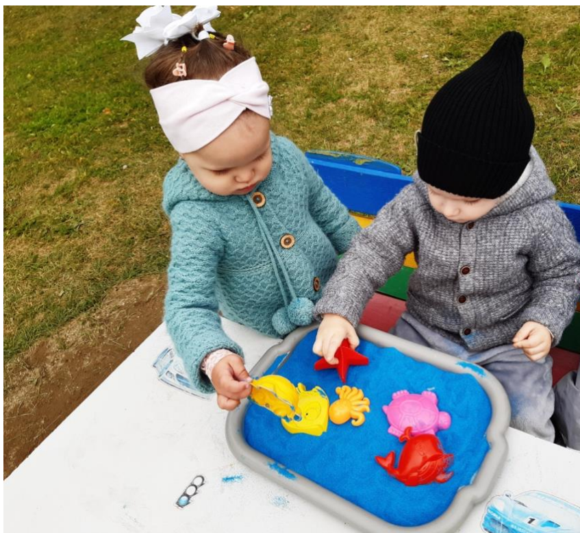
«Морские жители»( лепка из цветного песка)