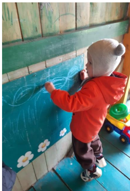
Рисование мелом «Дождик кап-кап»