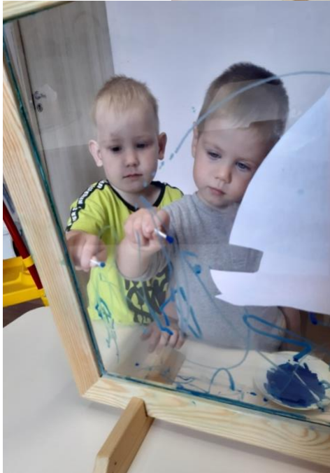
Рисование на прозрачном мольберте «Плыви, плыви, кораблик»