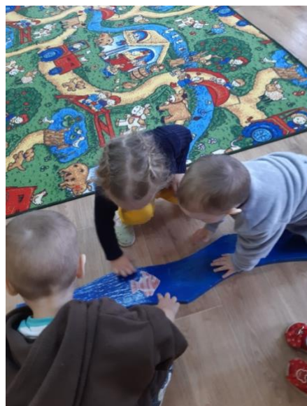
Подвижная игра «Перепрыгни через ручеёк»