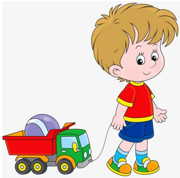
Играть с машинкой.