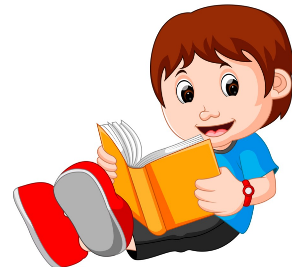
Держать книгу .