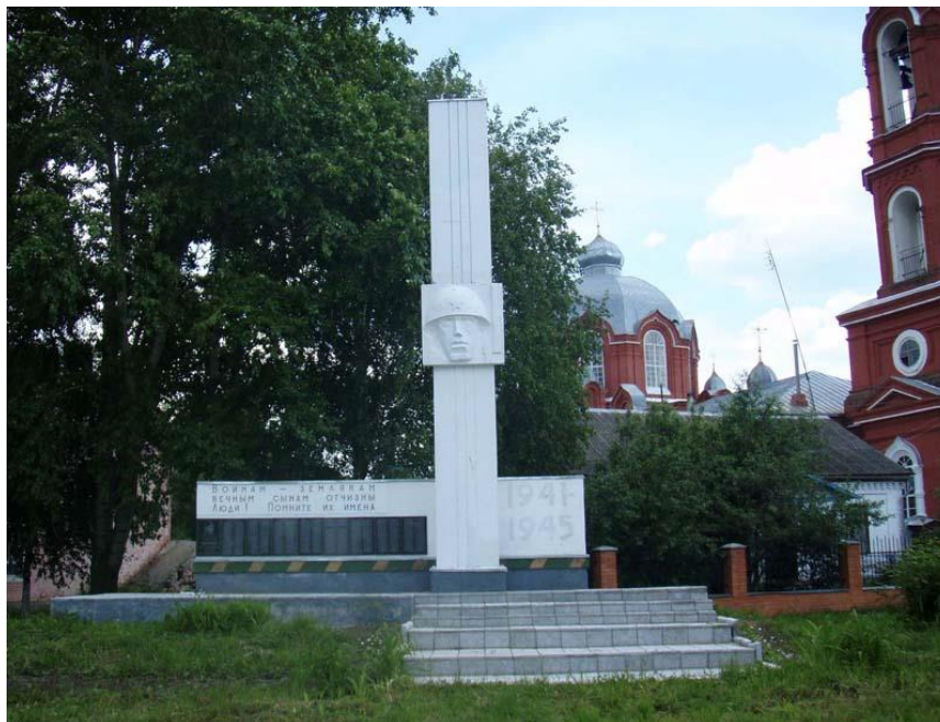
Памятник павшим землякам.