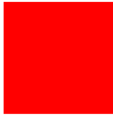
квадрат красного цвета