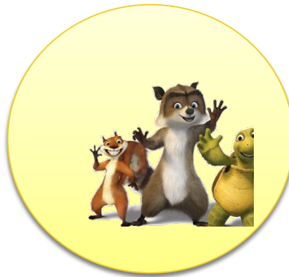
Эмблема команды «Лесная братва»

-Перед тем как нам начать я представлю вам жюри, и проведем не большую разминку.