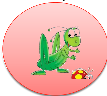
Эмблема команды «Кузнечики»

Название второй команды: «Лесная братва»;